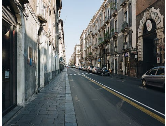
PLAYA DI CATANIA