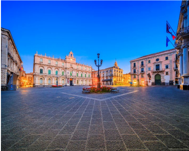
PIAZZA TEATRO MASSIMO